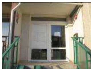
BD Praha 4