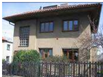
RD Praha 6