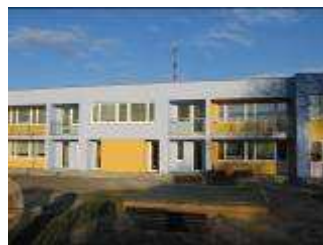
MŠ Praha 4