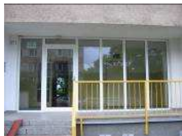
BD Praha 4