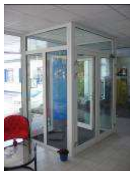
Atlas AG Beroun