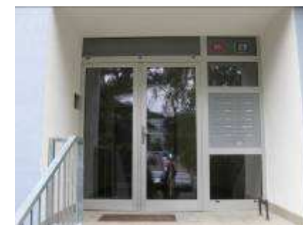
BD Praha 4