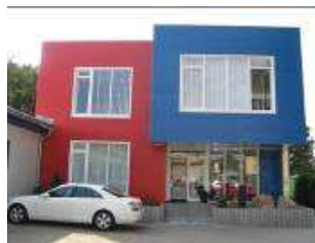
Atlas AG Beroun