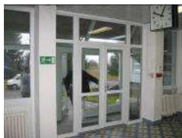
Atlas AG Beroun