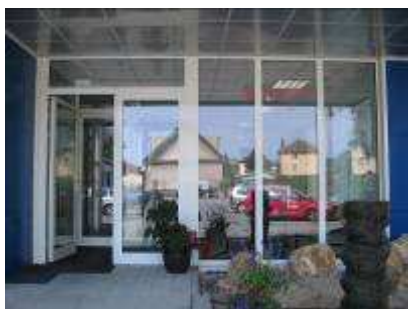
Atlas AG Beroun