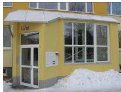
BD Praha 4